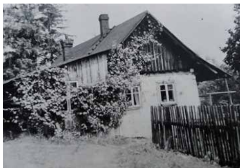
Původní dům č. 164