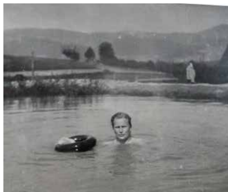
Rybniček u č. 198