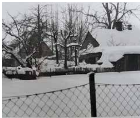
Dům č. 103

Děkuji mu za milé povídání, část vzpomínek a čas, který mi věnoval.