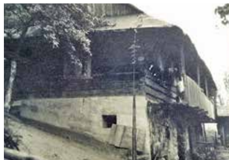
Ojcowski dom č. 92